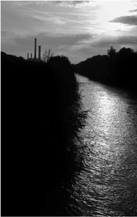
Zum Verlieben: der Fluss plus Heizkraftwerk

Wenn ich schlecht drauf bin, umarme ich schon mal die Kastanie, die ihre dicken Äste warnend und schützend über die verkehrsreiche Innere Wiener Straße hält. Auf dieser habe ich schon magische Mehlspiralen gestreut.