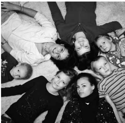
24 Abschied: Das Jahr mit unserer Bilderbuchfamilie geht zu Ende