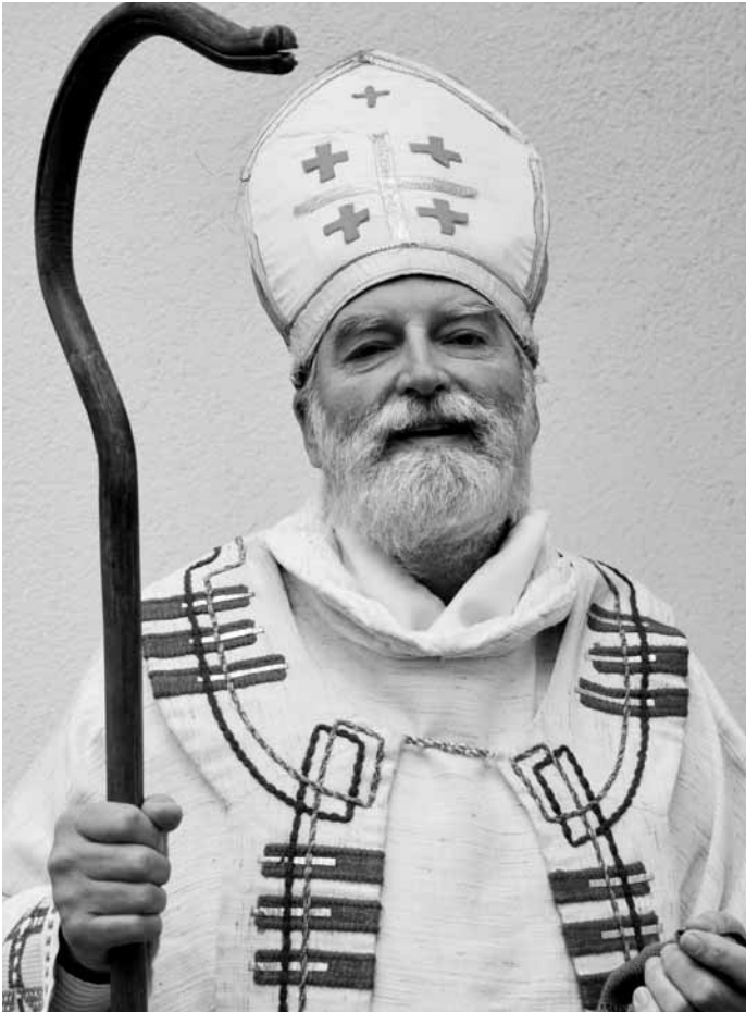
... und als Nikolaus