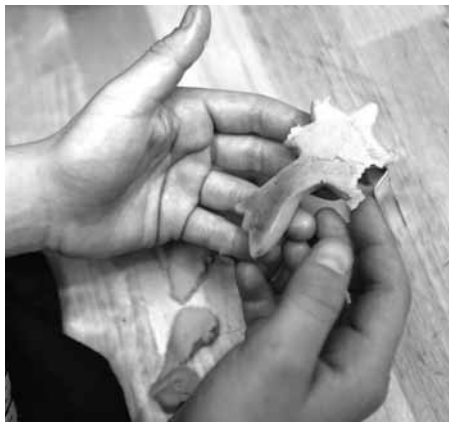
1 Der Stern von Bethlehem strahlt nicht nur, er wird auch schmecken.

Text: Annette Leyssner