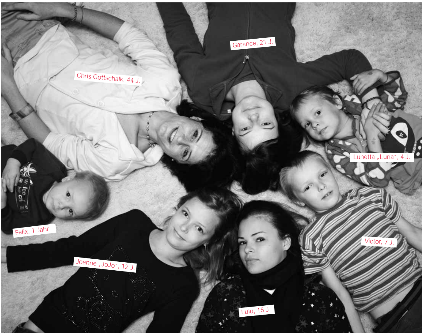
7 ... und am Jahresende.

Ab Januar begleiten wir eine Schulklasse auf ihrem Weg zur Mittleren Reife.