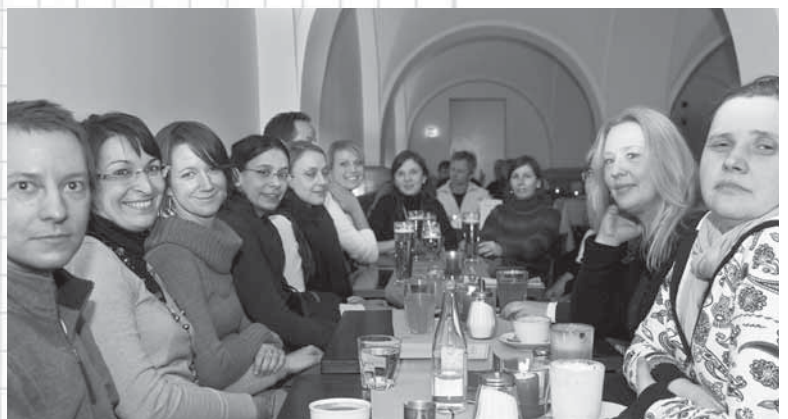
11 ... die Literaturfreunde den Abend noch gemütlich im Café Literaturhaus ausklingen lassen.