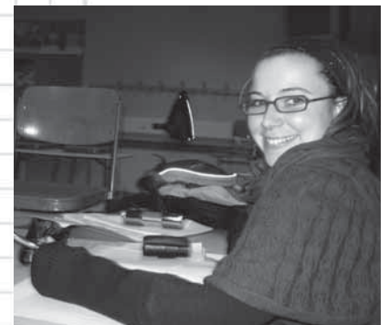
9 ... Marina ...