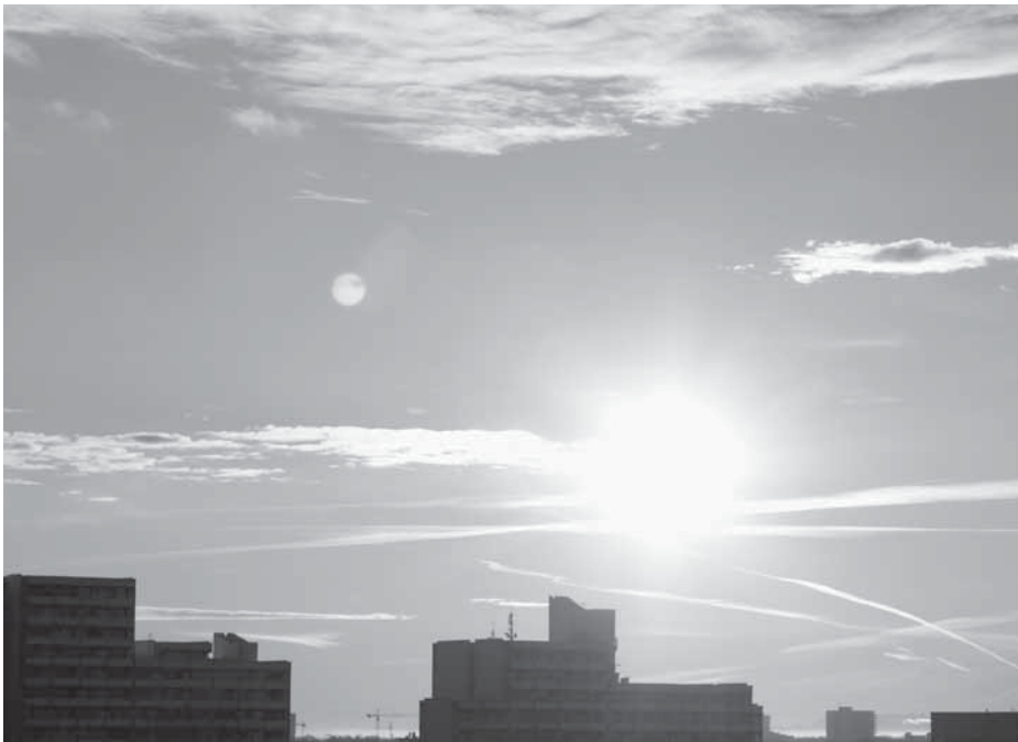
Foto des BISS-Verkäufers Hans Pütz aus dem Fenster seiner Wohnung in Nordschwabing