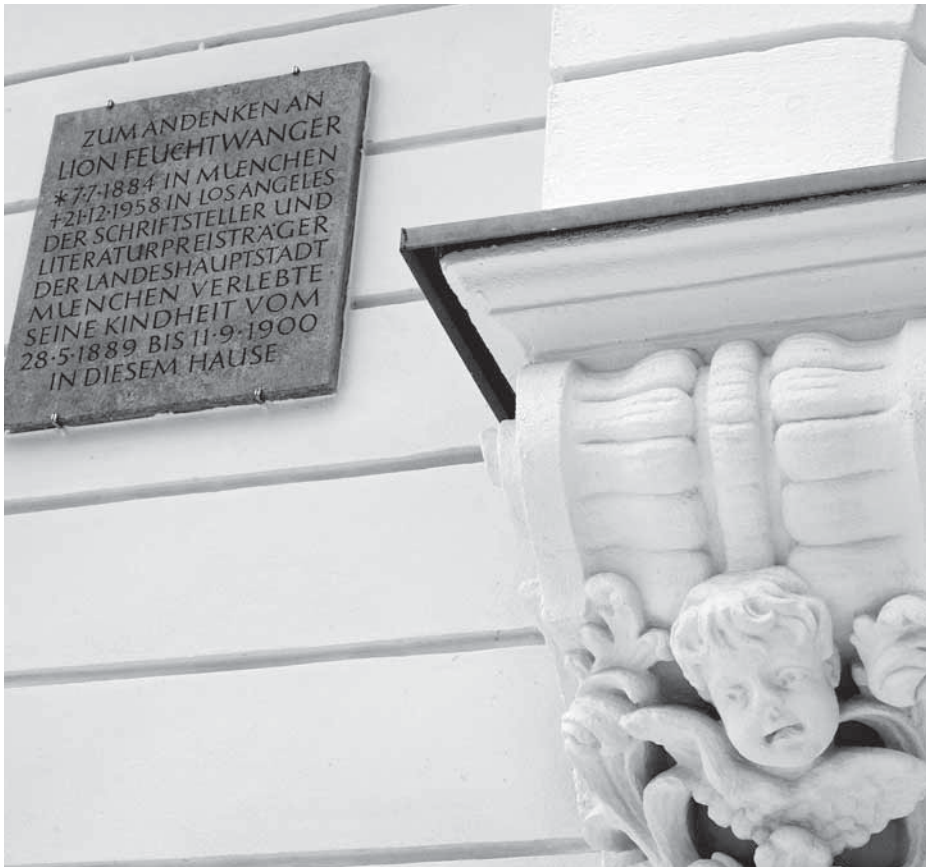
... von dem aus man auf das Haus blickt, in dem Lion Feuchtwanger lebte