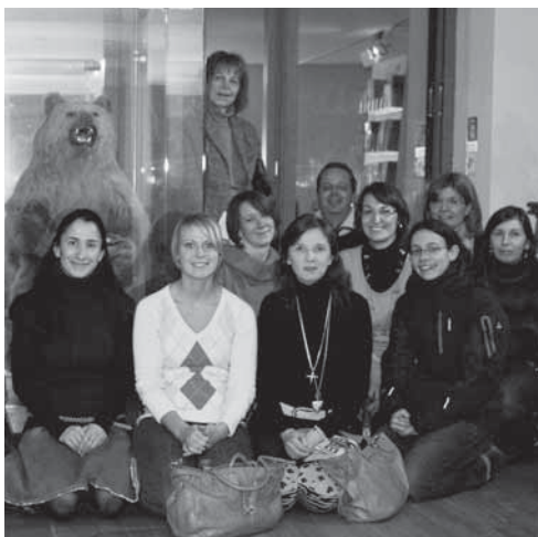
24 Ausflug: die Bildungsbürger im Literaturhaus. Links der Bär aus Thomas Manns Villa