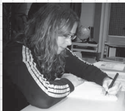
8 Als da wären: Christina ...